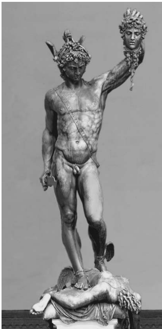
Персей с головой Медузы. Бронзовая статуя итальянского скульптора Бенвенуто Челлини. 1545–1554

Мужское трансцендирующее устремление в сфере чувственности находит свое выражение в образе единственной . В трансценденции “единственной” одновременно присутствуют и отрицание старого полового расклада, и соответствующая метафизикация себялюбия. Причем оба момента теснейшим образом взаимосвязаны и экстремализованы в идеалистическом типе мужчины — с более живым воображением, обостренной, не прагматически ориентированной интуицией. Отрицание прежнего полового расклада заключается в отказе от естественного полового индифферентизма (все женщины в принципе эквивалентны в отношении как воспроизводства потомства,