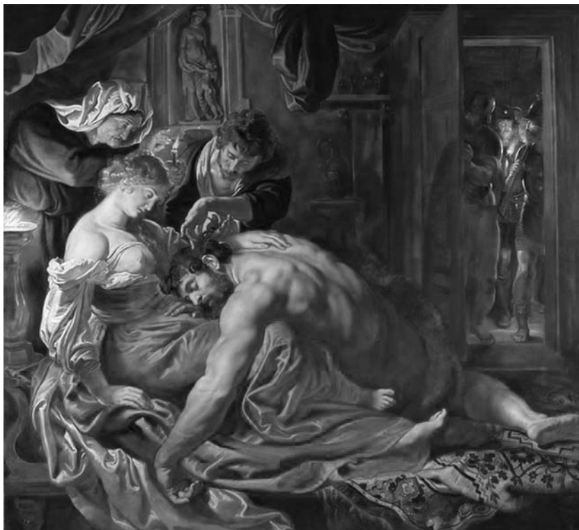
Питер Пауль Рубенс. Самсон и Далила. Ок. 1609

смысла ее бытия. Причем по своему внутреннему энергетическому потенциалу женская активность неизмеримо выше мужской потому, что она предназначена обеспечивать воспроизводство другого (своего ребенка) в себе . Женщина также органически не способна феерически-бездумно разбрасывать свои силы и энергию, распоряжаться своей жизнью, как то делает мужчина: “моя жизнь, что хочу, то и делаю, тем более что жизнь дается только раз” — и мужчине действительно она дается только раз. У женщины жизнь не одна, ей дается потенциально еще несколько жизней — ее детей. Сама же она, переживая их начало в себе, каждый раз переживает новое рождение и себя. Не говоря уже о том, что плоть женщины продолжает жить потом и в детях. Воистину бессмертное существо.