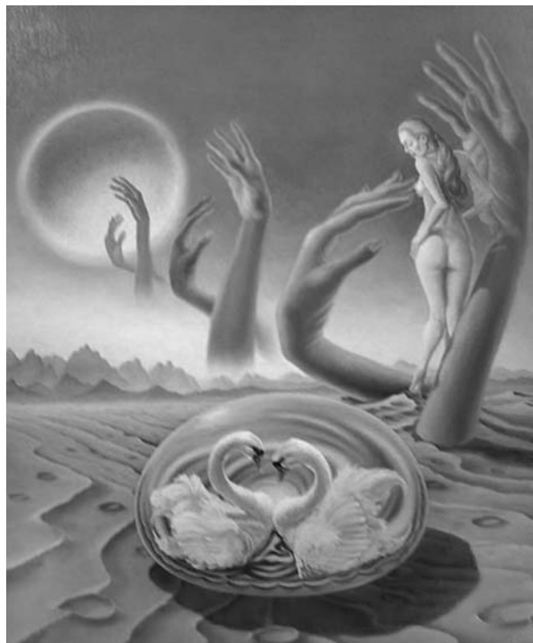
Дьори Ломюллер. Любовь. 1962

и соответственно большей терпимости, что определяет ее (ревности) чрезвычайную эффективность в спрямлении извилистых душевных троп чувственности к полному слиянию сердец. Ревность, как безжалостный скальпель “хирурга чувственности”, удаляет препоны гордыни, заставляя пожухнуть и себялюбие мужчины, и женский настрой на контроль.