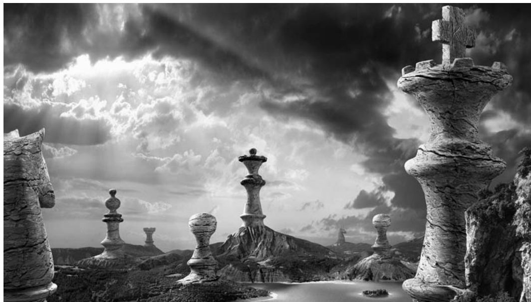
Chess Statue Surreal Manipulation (Шахматный сюрреализм).

ния — тайны познания, знания, науки, философии и пр.; помыслы в области общения — тайны приобщения к коллективу, участия в сообществе и пр. Отсюда и различие тайн познания и тайн общения: первые ближе к интересам, желанию ознакоми́ться, знать, познавать, вторые — к потребности быть включенным в некое сообщество. Истоки родства названных видов потребностей коренятся, на наш взгляд, в глубинной связи познавательного и игрового моментов в эволюции психики.