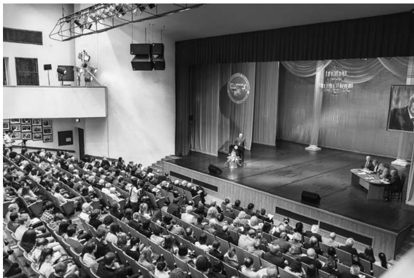
XIV Международные Лихачевские научные чтения. Санкт-Петербург, май 2014

то — как у Чехова — “картина лунной ночи готова”.