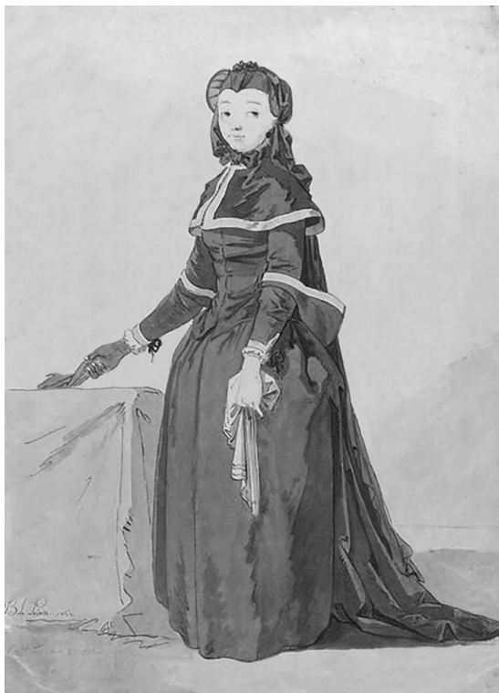
Жан-Батист Лепренс. Дама в русском платье. Гравюра. 1762

Началом 1760-х годов датируется написание художником картины “Вид Дворцовой набережной” 3 , которую, как предполагают, заказал маркиз де Л’Опиталь. На картине представлены панорама Невы, строящаяся набережная перед Зимним дворцом, грузчики и мастеровые, прохожие, телеги, разные товары. Вдали видны очертания Петропавловской крепости и стрелки Васильевского острова, река заполнена судами, небо покрывают облака. На переднем плане изображена живописная группа вельмож в белых париках с буклями и разноцветных кафтанах, среди которых присутствуют маркиз Л’Опиталь и врач г-н Пуассонье. Это полотно французского художника запечатлело момент грандиозного строительства новой столицы и ее разноплеменное население.