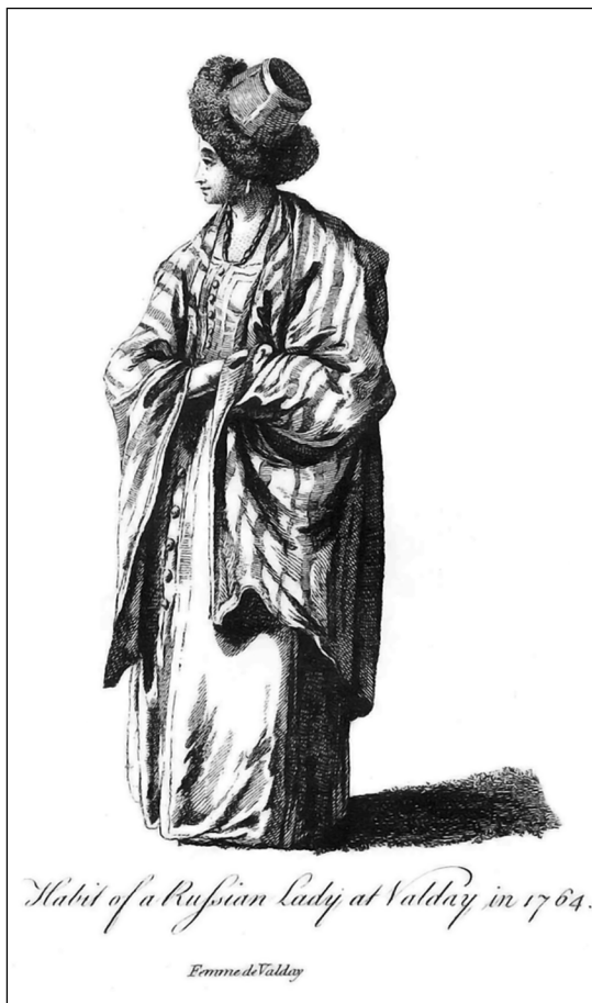
Жан-Батист Лепренс. Женщина Валдая в 1764 году. Гравюра из книги "A Collection of the Dresses of Different Nations, ancient and modern. <...>" (L., 1772. Vol. 3)

скорее всего, вшитом из темно-синего бархата дорожном платье (или шубке) с капюшоном, меховой отделкой по краям и золочеными шнурами на груди. На ее голове — большая шапка из той же материи, с меховым околышем, украшенная шнурком с кисточкой.