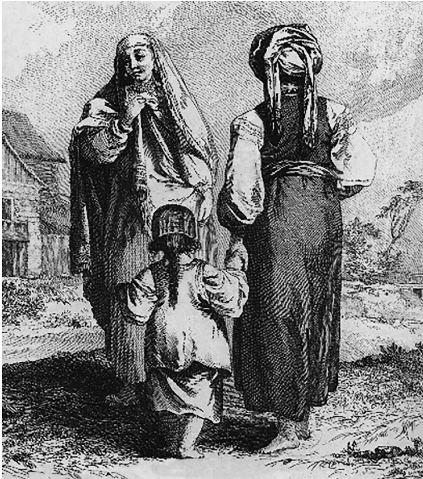
А. Жабрева Россия середины XVIII века глазами Жана-Батиста Лепренса