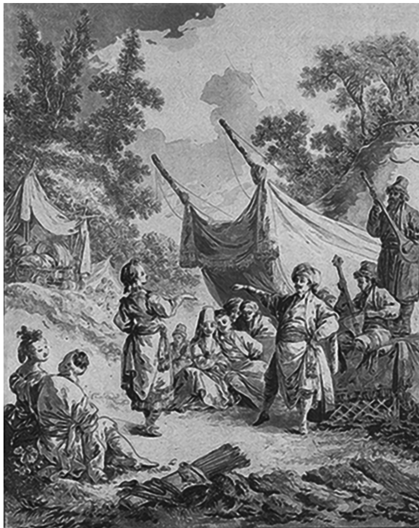
Жан-Батист Лепренс. Русский танец. 1769. Гравюра

бирь” 5 и отдельно изданных серий использовались для иллюстрирования отечественных и иностранных изданий по русской истории в качестве образцов для изображения национальных типов России.