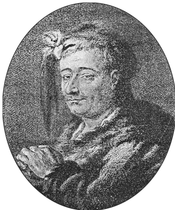
Жан-Батист Лепренс. Автопортрет в русском платье. Гравюра с живописного портрета, выполненная для книги Ж. Геду “Jean le Prince et son oeuvre” (“Жан Лепренс и его произведения”, 1879)

Документы свидетельствуют, что Лепренс “выписан был из Франции в 1757 году в Петербург, для исправления казенных новейших по его искусству живописных работ, яко-то исторических, ландшафтных картин над дверьми и над каминами в Зимний Ея Императорского Величества дом”. Для испытания таланта художнику было поручено написать две картины,