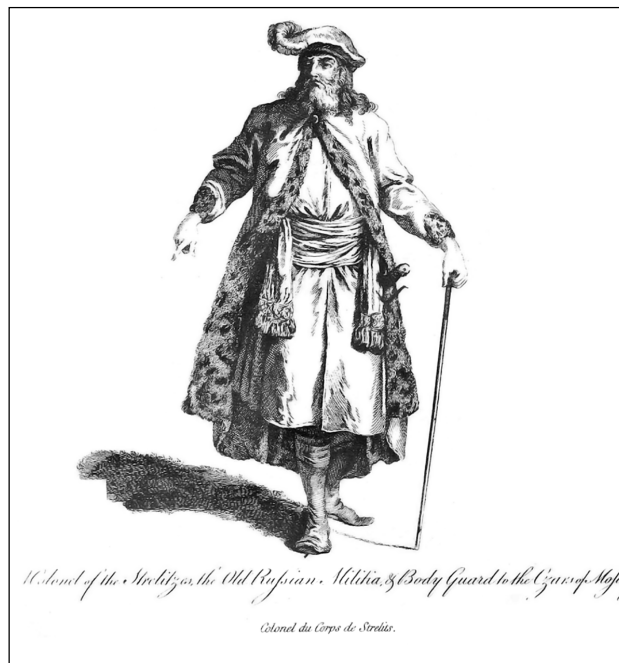
Жан-Батист Лепренс. Стрелецкий полковник, или Телохранитель московских царей. 1764. Гравюра из книги “A Collection of the Dresses of Different Nations, ancient and modern. <...>” (L., 1772. Vol. 3)