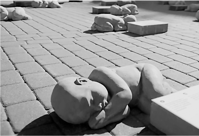
Рис. 2. Акция “За жизнь”. Рига, Латвия

отсчета человеческой жизни, именно как качественно человеческой, выступает момент зачатия. Поэтому любое посягательство на эмбрион рассматривается как причинение вреда жизни, а аборт — преднамеренное убийство [10].