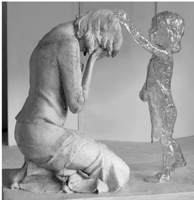
Рис. 1. Мартин Худачек. Скульптура Словакия

надпись «и ее нерожденный ребенок» [15, р. 183]. Конечно, если рассматривать этот мемориал с точки зрения его роли и значения для родственников погибших, не возникает никакого сомнения в необходимости подобного указания на еще не рожденных детей. Но, оценивая эти надписи в социокультурной перспективе, мы встаем перед весьма трудными вопросами: «Что происходит, когда мы признаем еще не рожденных жертвами, когда легитимизируем в свете насильственных обстоятельств жизнь плода? Более того, если нерожденные дети понимаются как жертвы, то, что это означает для «всех нас», каков смысл этого принятия «жизни» плода, коллективной идентификации и особой значимости «нерожденных жертв насилия»?» [24, р. 62].