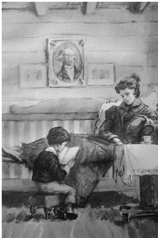
Л.М. Хайлов. Иллюстрация к роману С.Т. Аксакова “Детские годы Багрова-внука”. 1966

ния, даже грамотности... руководствуясь одной природною логикою” [10, с. 51], привела в порядок эти “сокровища” и сама составила план его образования. Стремясь приобщить сына к чтению, мать давала ему награду всякий раз, когда тот читал ей, и позволяла тратить деньги самому, что приводило подростка в восторг от дарованной ему самостоятельности [19, с. 188–189]. Крылов страстно любил мать, “замечая в ней необычайные способности”, видя “в ней существо гениальное между женщинами” [18]. Матери удалось сформировать у будущего баснописца не только страсть к чтению, но и трудолюбие и настойчивость — качества, необходимые для реализации природных способностей.