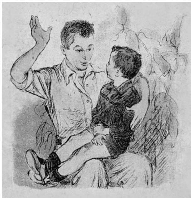
А.Ф. Пахов. Иллюстрация к стихотворению В.В. Маяковского «Что такое хорошо и что такое плохо». 1939

мышлений, а обидные слова больно задевали самолюбие, вызывая хохот одноклассников и грусть мамы, которой наставник характеризовал сына как рассеянного и ничего не понимающего. В то же время оскорбления порождали в душе маленького Зощенко протест и еще более серьезные размышления. В этом также кроется парадоксальность импрессионга. Истории Крылова и Зощенко свидетельствуют: импрессионг не теряет своего созидательного потенциала даже в том случае, если воздействие носит на первый взгляд отрицательный характер. Ценность творчества не только не была потеряна, но вопреки негативному настрою, ставшему фактором, усиливающим импрессионг, фактором преодоления негативного отношения социального окружения, закрепились в ценностной системе личности будущих писателей. Однако нельзя утверждать, что отрицательные импрессионги непременно влекут за собой раскрытие творческих способностей личности. Здесь налицо такая черта импрессионга, как избирательность: сочетание наследственности и социокультурного воздействия специфически отражается на разных людях. В приведенных нами случаях результат оказался положительным.