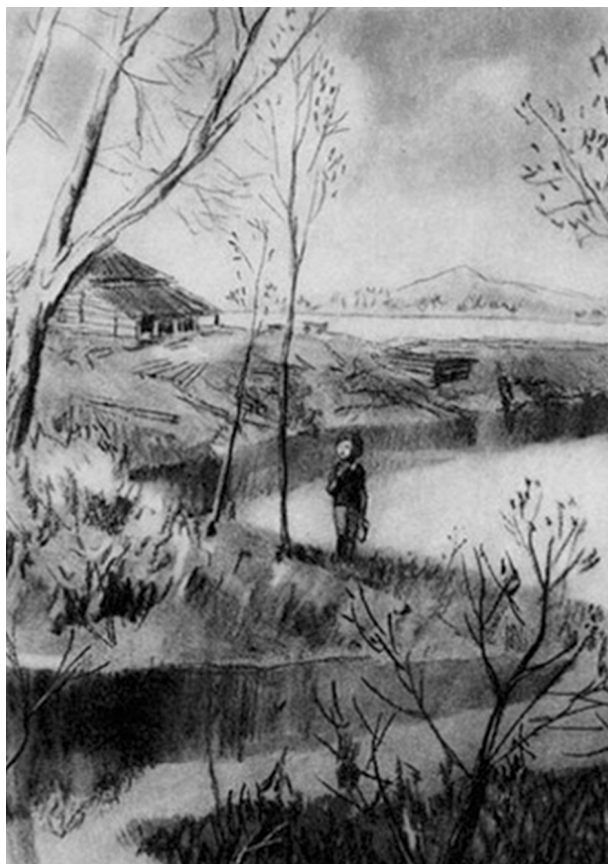
Д.А. Шмаринов. Иллюстрация к роману С.Т. Аксакова “Детские годы Багрова-внука”. 1936

Как уже говорилось, импрессионги могут быть как позитивными, так и негативными. Например, дарование баснописца Крылова развивалось на фоне нежелания учиться, вызванного двойственным отношением к нему богатого семейства Львовых — социокультурного окружения, в которое “по бедности” поместили мальчика родители, не имевшие возможности дать ему полноценное образование. Здесь мальчика учили “чему могли” и здесь же двенадцатилетнему Крылову довелось узнать, что такое унижение: нередко при гостях его использовали как прислугу, хваля и благодаря при этом [12]. Будучи у Львовых, желания учиться Крылов не испытывал, зато испытывал страстное желание читать, “с жадностью читать все, что ни попадалось ему в руки”, особенно произведения сатирические,