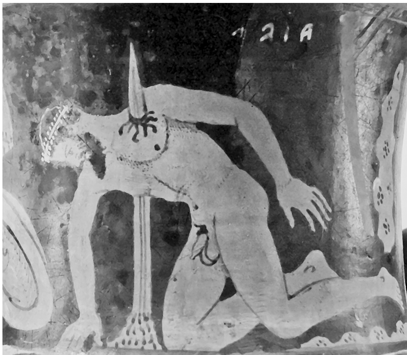
А. Прокофьев Стыд без “Ока Других”

Дева сильная, Зевса дочь, меня в смерть позором гонит (из трагедии Софокла “Аякс” в переводе Ф.Ф. Зелинского). Самоубийство Аякса. Этрусский краснофигурный кратер. Фрагмент. 400–350 годы до н.э.