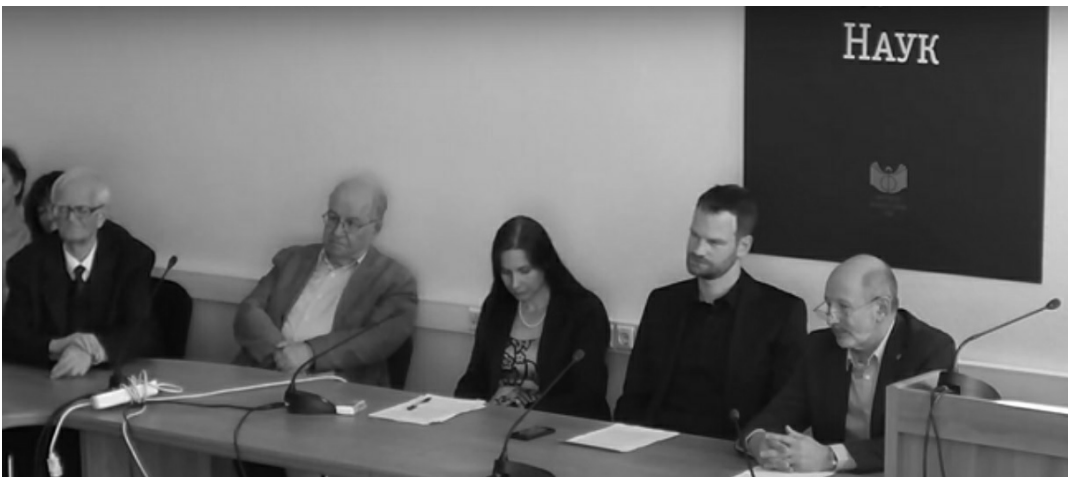
Зал заседаний Ученого совета Института философии РАН. 14 сентября 2014 года

вынужден отказываться от исследования. И что здесь важнее: интересы научного исследования или этические соображения? Здесь мы наталкиваемся уже на запрет на исследования или, в лучшем случае, на рекомендацию отложить проект на неопределенный срок. И утверждавшая это “Этика науки” была для того времени пионерской работой. По крайней мере, в нашей литературе.